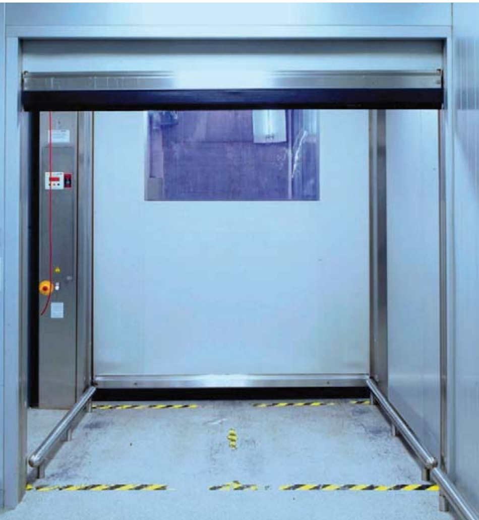
Двоє EFA-SRT®-CR воріт об'єднані в тамбур (повітряний замок)

Часто є необхідність в створенні тамбура (повітряного замка) з двох воріт між чистим та зовнішнім приміщеннями, або між двома чистими приміщеннями з різним середовищем. Найбільш прийнятним варіантом буде об'єднання двох високошвидкісних воріт EFAFLEX з відповідними характеристиками. В залежності від наявного простору, можливі різні варіанти комбінації воріт серії CR.