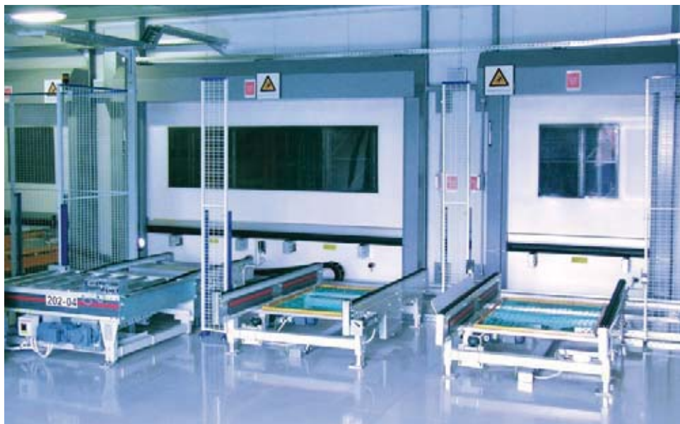
EFA-SRT®-CR на конвейерній системі