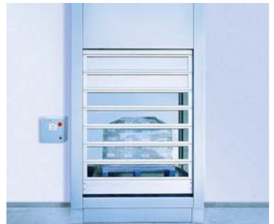
Тамбур з EFA-STT®-CR та EFA-HVS®-CR

Часто є необхідність в створенні тамбура (повітряного замка) з двох воріт між чистим та зовнішнім приміщеннями, або між двома чистими приміщеннями з різним середовищем. Найбільш прийнятним варіантом буде об'єднання двох високошвидкісних воріт EFAFLEX з відповідними характеристиками. В залежності від наявного простору, можливі різні варіанти комбінації воріт серії CR.