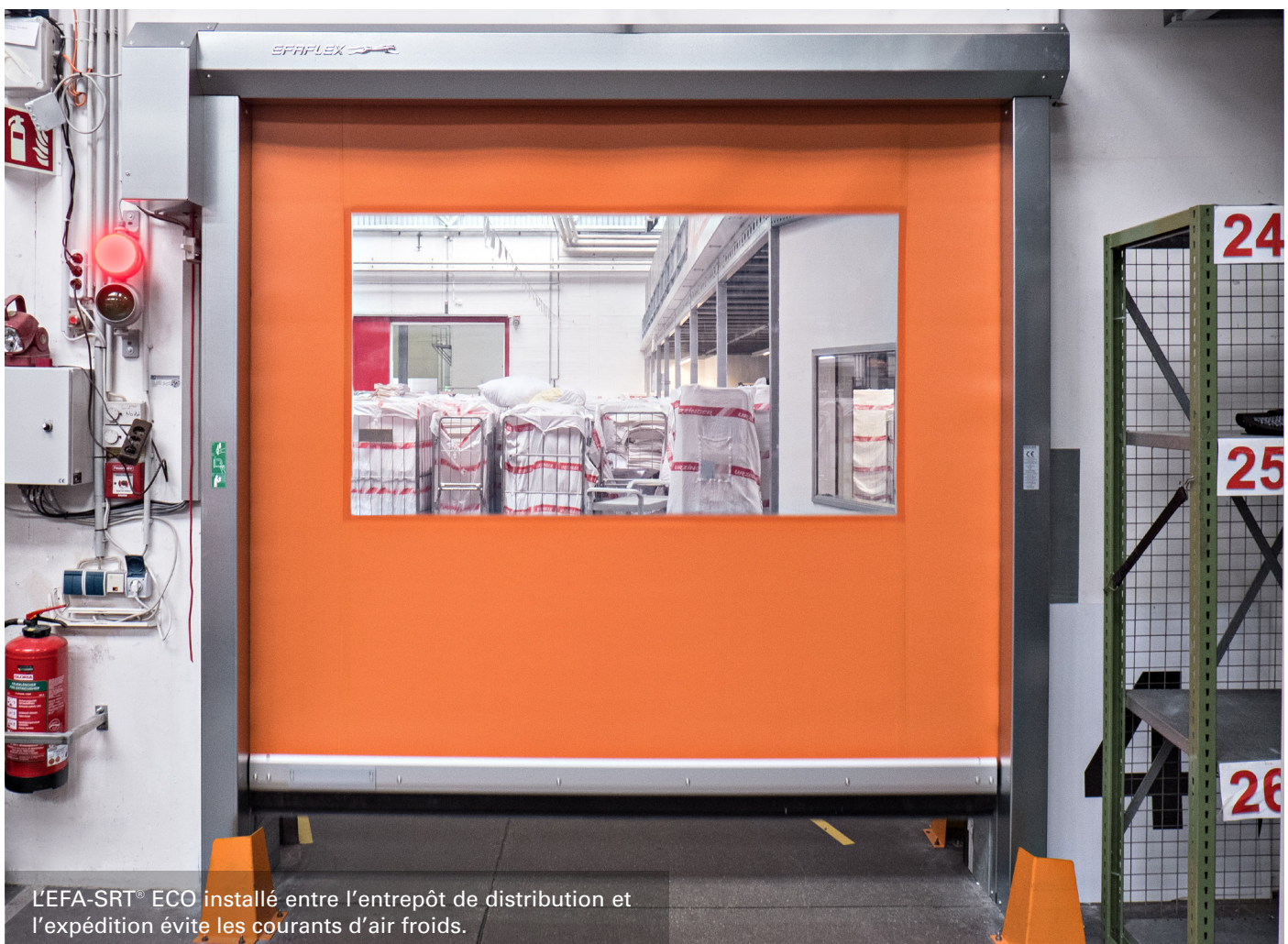
L'EFA-SRT® ECO installé entre l'entrepôt de distribution et l'expédition évite les courants d'air froids.

nombreux cycles de travail. En effet, environ 1 100 conteneurs de linge sont transportés quotidiennement de l'entrepôt de livraison au service expédition. Malgré tout, il fait désormais chaud et les employés de l'entrepôt de livraison en sont très satisfaits. « Je n'ai que des choses positives à dire sur EFAFLEX », déclare le directeur de production. « De la concertation avec le service commercial à la planification et au montage, tout s'est très bien passé. Le prix est correct et notre souhait d'installer un système de feux tricolores au niveau de la porte afin d'éviter les accidents a été immédiatement exaucé. » De plus, EFAFLEX se trouve juste à côté et le service après-vente n'est donc pas loin pour la maintenance.