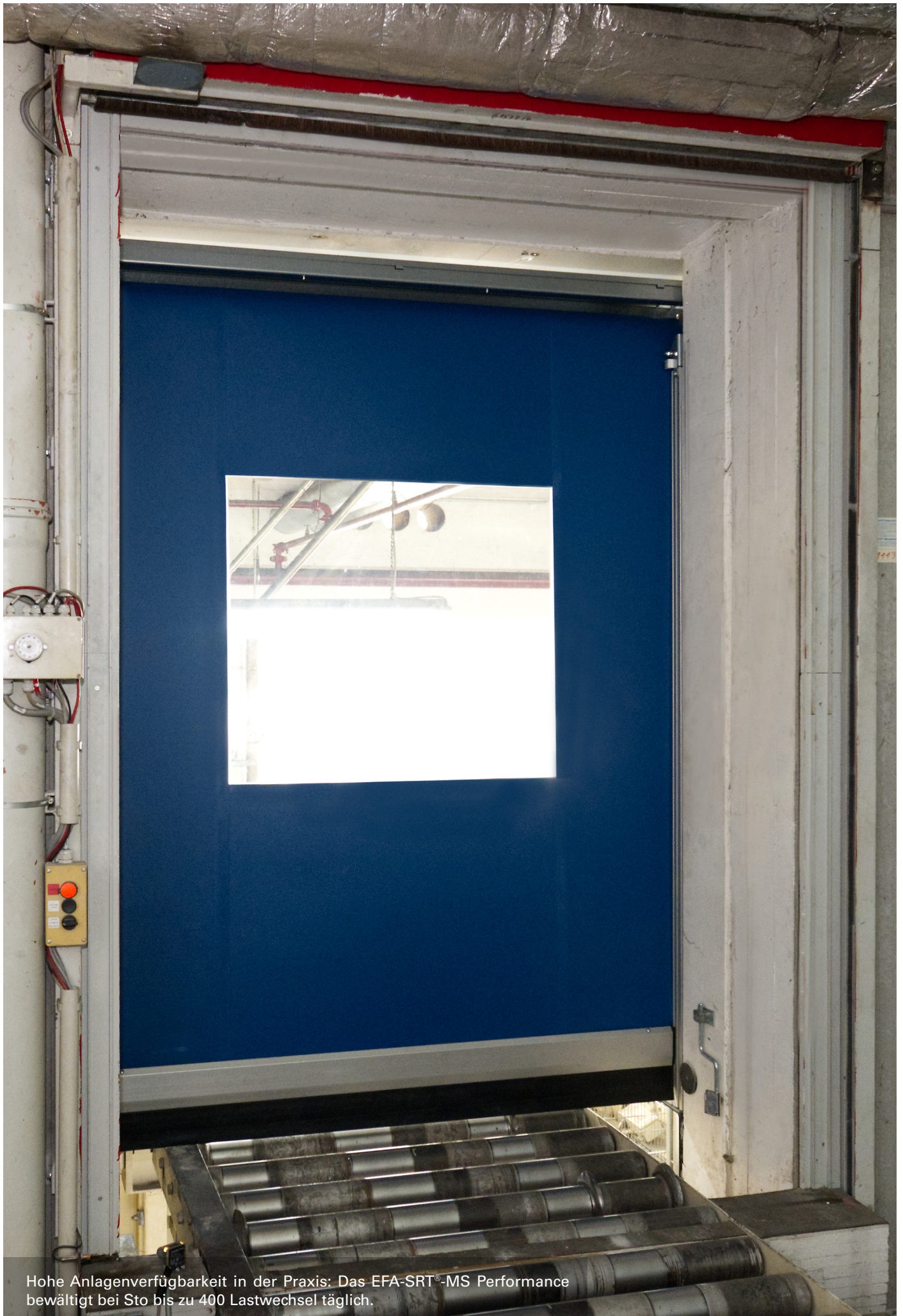
Hohe Anlagenverfügbarkeit in der Praxis: Das EFA-SRT ® -MS Performance bewältigt bei Sto bis zu 400 Lastwechsel täglich.