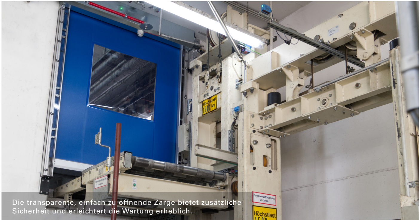
Die transparente, einfach zu öffnende Zarge bietet zusätzliche Sicherheit und erleichtert die Wartung erheblich.